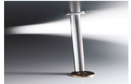
Eng toleriertes Plattentellerlager: Reduziert Rumpeln & Gleichlaufschwankungen