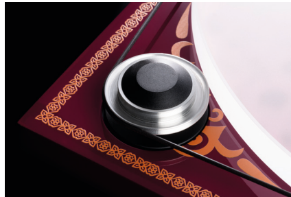
Diamantgeschliffener Aluminium-Pulley: präzise Kraftübertragung