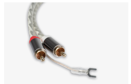
Hochwertiges Audiokabel Connect it E: Optimale Signalübertragung