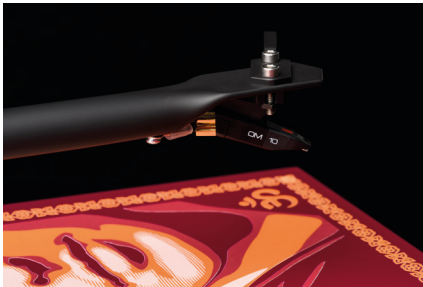
Hochwertiges Tonabnehmersystem: Ortofon OM10 -> fehlerfreie Abtastung

Muster und der analogen Mix-Konsole (unter dem Acryl-Teller) einen einzigartigen Look. Dieses unbestrittene Meisterwerk ist auf 2500 Stück weltweit limitiert.